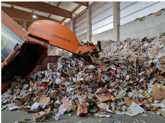
Entleerung der Altpapiertonnen: Sortenreine Altstoffe sind wertvoll.

Der Betrieb der ASZ konnte bisher zu einem großen Teil durch diese Erlöse finanziert werden – ein Garant für moderate Abfallgebühren.