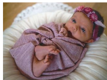
Auer Mila Kirchenfeld 35