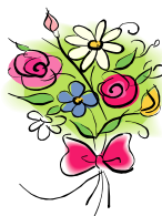
Gütlinger Berta Stieglhof 2 (85)