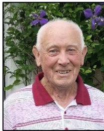
Scharinger Johann Untwüsten 4 (85)