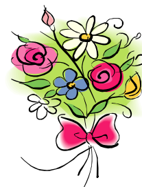
Lehner Hedwig Obererleinsbach 9 (80)