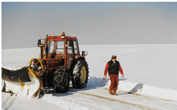
Same-Traktor (PS 85) 1988

Seitens der Gemeinde Steegen bedanken wir uns sehr herzlich für deinen jahrzehntelangen unermüdlichen Einsatz für die Gemeinde sowie für die Bevölkerung von Steegen!