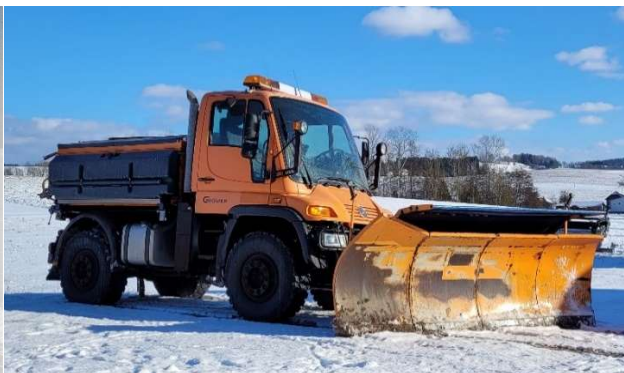
UNIMOG-Mercedes (PS 175) 2026